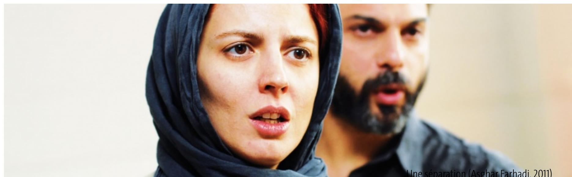
Une séparation (Asghar Farhadi, 2011)